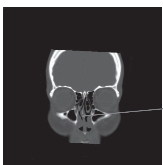
真ん中の骨が右鼻腔側へと彎曲し、鼻腔内が狭くなっています。

⑤ 世渡りの「ツ」 「素直な性格」の方の場合、前回は「素直な性格」の方が、日常生活上、本当に困った事態に遭遇し、どう行動したら良いかわからなくなり、切羽詰まった状態になっている時、その方を迷わせないことが重要であり、そのためには、「具体的な」「断定的に」「繰り返す」「時機を失せず」に「同じ内容のアドバイス」をすること、「余計なことは話さない」ということが肝要であることを書きました。