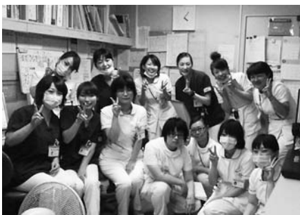
8階西病棟看護スタッフ

患者さまは意識の低下があり、お話しすることが難しい期間が続いたのですが、忙しい中ご家族は