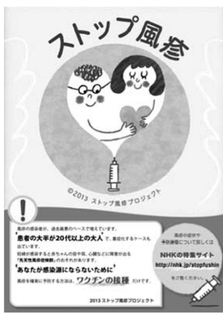
2013ストップ風疹プロジェクト啓発ポスター

今、成人の風疹が大流行中です。大都市圏を中心に、今年はずで全国で1万人を超え、規模となつており、大半は成人男性。風疹は成人男性。風疹病や脳炎などの重症例もはつておとなの病気があります。最も心配されていることとしては、先天性風疹症候群です。風疹の抗体が不十分な女性が妊娠早期に風疹にかかると、ウイルスが胎盤を通して赤ちゃんに感染し、生まれつきの難聴や心臓病、白内障、さらには精神遅滞を引き起こすことがあります。この非常事態に対応して、妊娠希望女性や妊婦の夫などを対象に、多くの自治体は予防接種費用の無料化もしくは補助を決定しました。風疹は症状が出る前から感染力があり、実際にはどこでうつたかわからない患者さんもいることを考えれば、さらに幅広く、たとえ自費でもできるだけ多くの方に抗体をつけて欲しいものです。補助金の規定などは、お住まいの自治体にお問い合わせください。予防接種は当院でも行つております。(要予約)