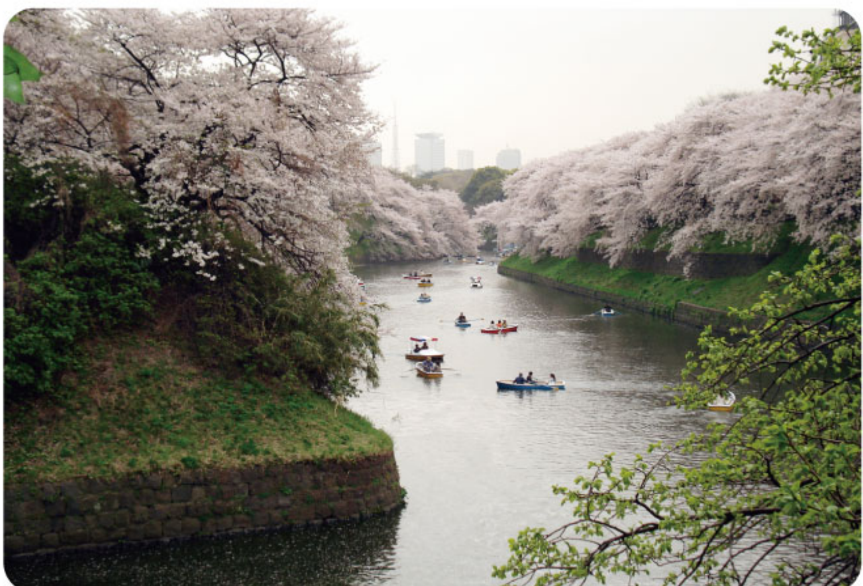
春は桜のお花見、北の丸公園の散歩も楽しい