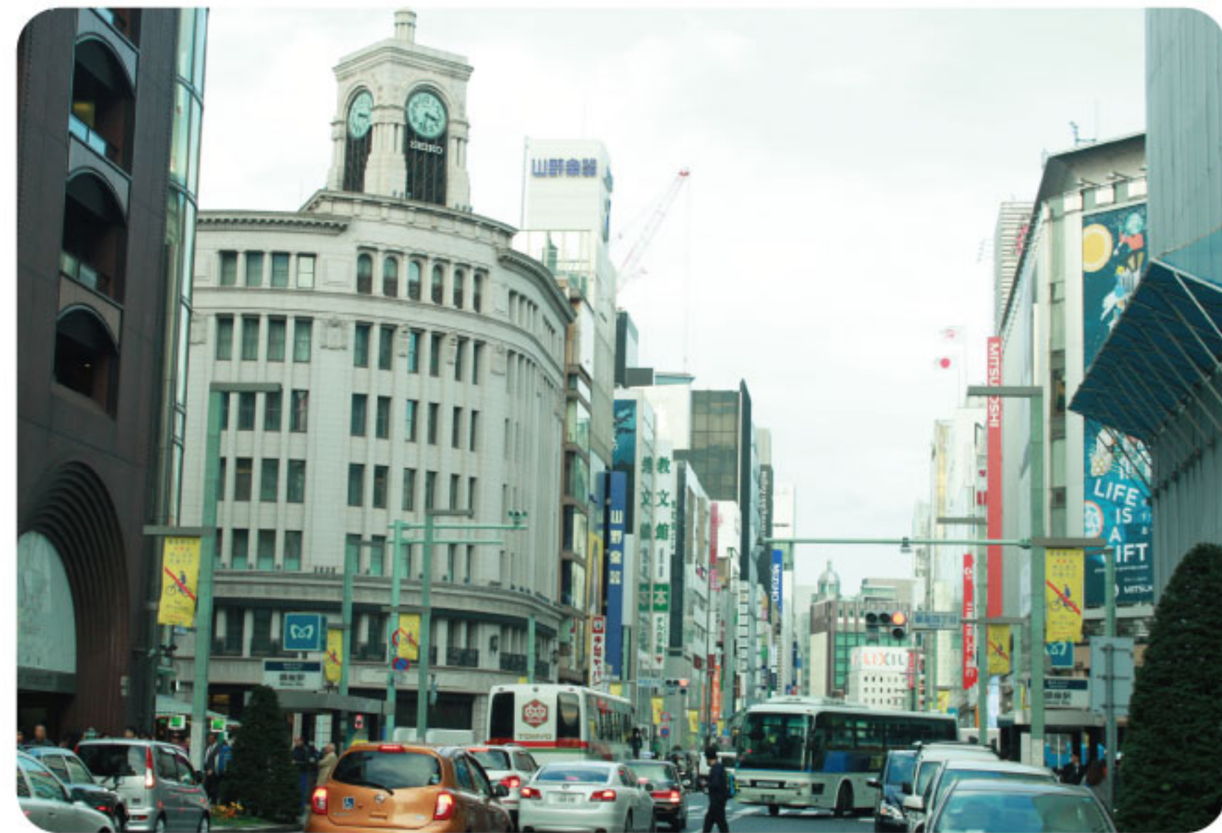
おしゃれなお店で、ショッピング&グルメ!