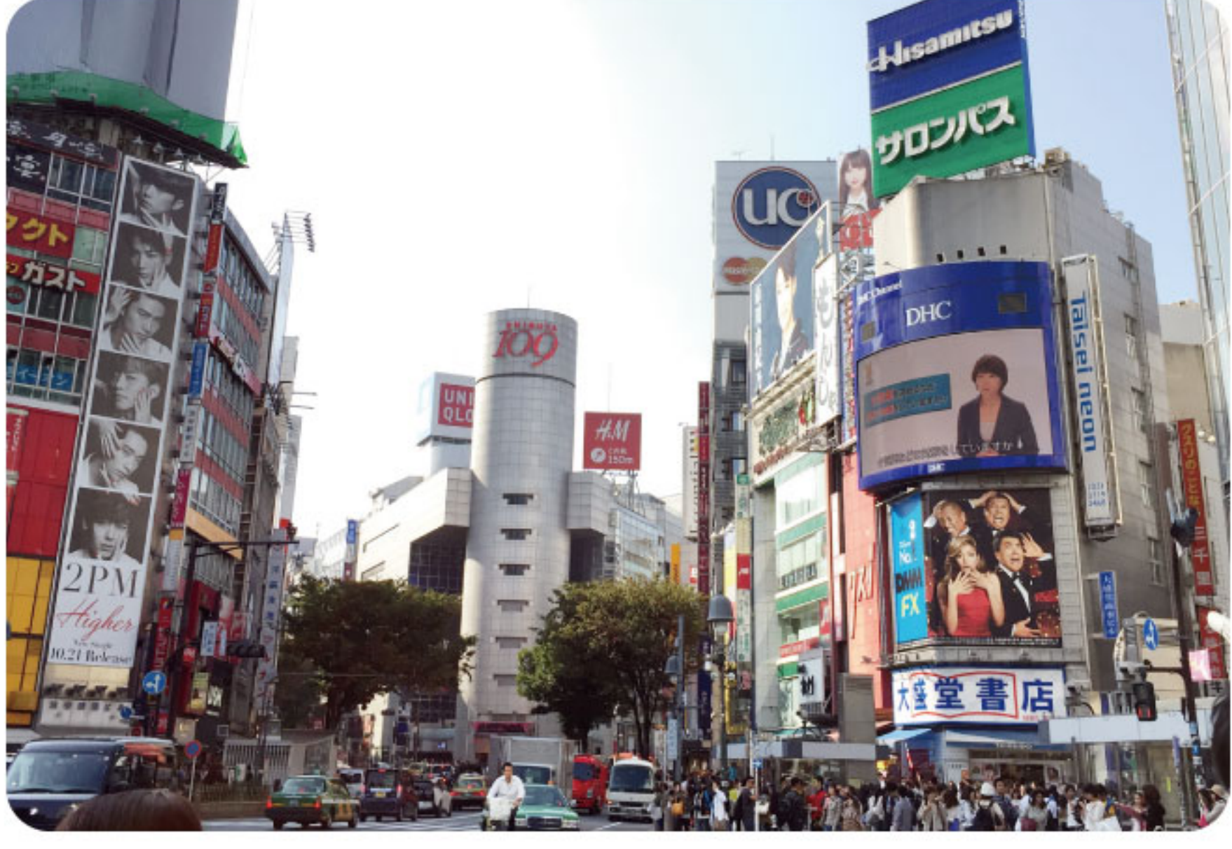
休日は、テレビで紹介されたあの店へ!