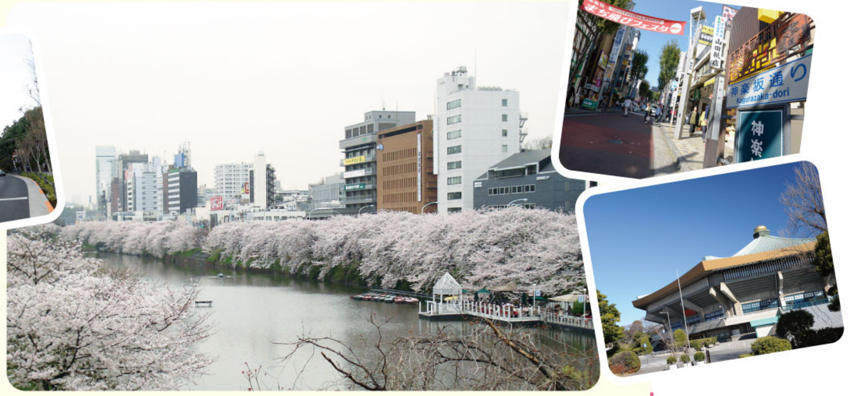
飯田橋駅から病院までの街並みはとても綺麗。 外濠周辺や神楽坂にはおしゃれなお店もたくさん。 日本武道館でのライブも徒歩で行けます。