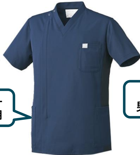
ネイビー 男女共用