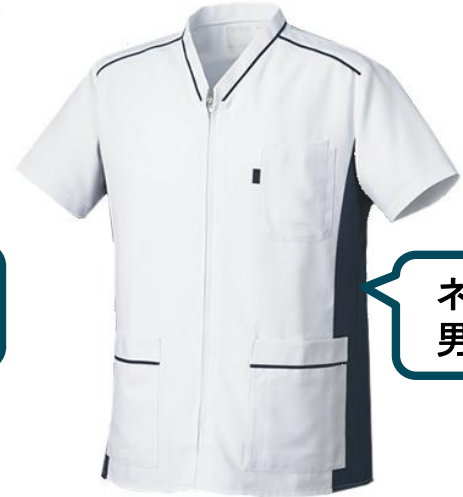
ネイビー 男女共用