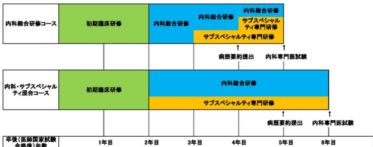
図1. 東京通信病院内科専門研修プログラム（概念図）：